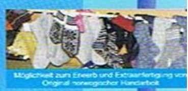
Möglichkeit zum Erwerb und Extraherfertigung von Original norwegischer Handarbeit